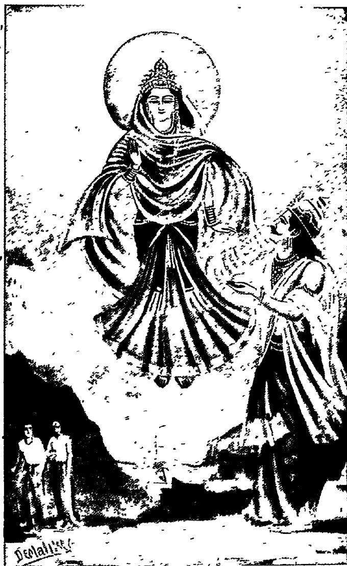
उमा और इन्द्र